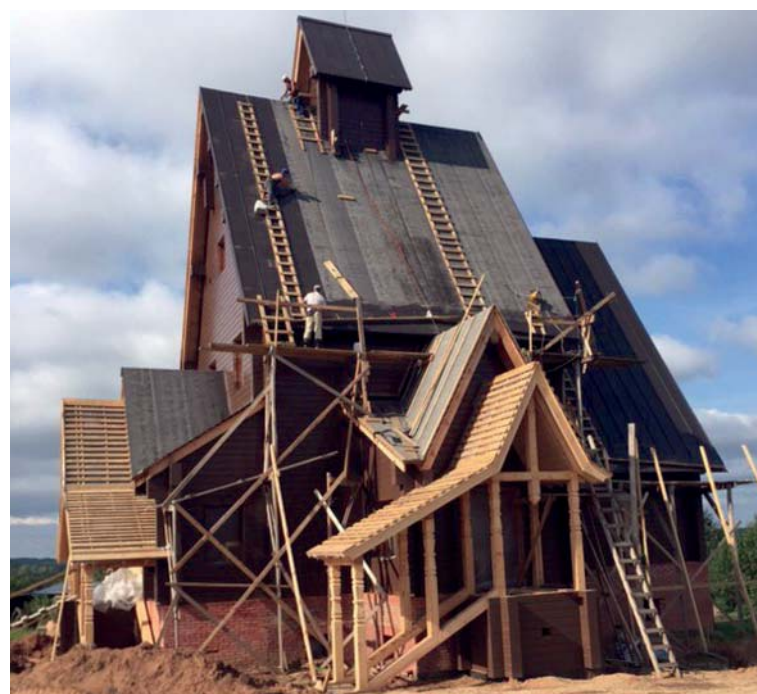
Полосу подготовила Мария КАВИНОВА